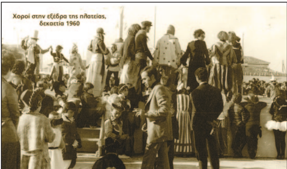
Ελλείπει σχετικής φωτογραφίας, χορός στην κεντρική πλατεία τη δεκαετία του 1970

χώρο που βρίσκεται σήμερα το πάρκινγκ βορειώς του πάρκου αλλά στη συνέχεια το σχέδιο άλλαξε και το σχολείο κατασκευάστηκε στη σημερινή του θέση. Γράφει λοιπόν ο Λουκάκος: “Σπανίζουν πράγματι τέτοιες επιτυχίες σε χοροεσπερίδες σαν την προχθεσινή του Σαββάτου που δόθηκε στην αίθουσα “Τιτάνια” υπέρ της θεμελιώσεως διδακτηρίου στο Νησί. Την σπάνια αυτή επιτυχία την αποδίδουμε σε δύο παράγοντας: Ο πρώτος είναι το κορύφωμα κόπων των συμπαθών μας εκπαιδευτικών της στοιχειώδους της πόλεώς μας. Ο δεύτερος είναι η πλήρης κατανόησης του ιερού σκοπού για τον οποίο εδίδετο η χοροεσπερίς, ευχάριστον δηλαδή φαινόμενο, το οποίο φανερώνει πως ο πολιτισμένος κόσμος επικροτεί κάτι το ευγενές, κάτι το απαραίτητον που πρέπει να γίνη στον τόπον του. Εκείνο δε εν ολίγοις που διεπίστωσα το προχθεσινό βράδυ, είναι η υλική και ηθική προθύμως συμπαράστασις των κατοίκων του Νησιού δίπλα από τους δημιουργούς της προχθεσινής βραδυάς αγαπημένους μας εκπαιδευτικούς. Να γιατί πρόθυμα τα καταστήματα της πόλεως που αν και διανύουν την κρισιμωτέραν ανεργίαν προ-