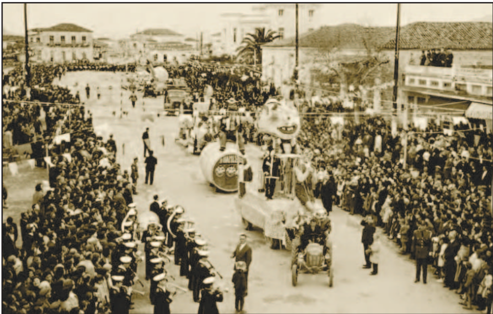
Το Νησιώτικο καρναβάλι γύρω στα 1960

Η πρώτη περιγραφή του Νησιώτικου καρναβαλιού το 1893 φαίνεται πως αποτελεί σημείο καμπής: Κρατά τα παραδοσιακά του χαρακτηριστικά αλλά με τρόπο ατελή, προσαρμόζεται στην ιδέα του θεάματος καθώς πλέον μπορούν να φθάσουν από Καλαμάτα και πολλά μακρινά χωριά με το τρένο στο Νησί. Αποτελεί ουσιαστικά μια γέφυρα για την “εισαγωγή” στοιχείων του αστικού καρναβαλιού, κάτι που πραγματοποιείται στο διάστημα μέχρι το 1900. Η Κρητική επανάσταση (1895-1898), ο ελληνοτουρκικός πόλεμος (1897) και η επιβολή του Διεθνούς Οικονομικού Ελέγχου (1898) είναι μεγάλα γεγονότα που μεσολαμβάνουν στο διάστημα αυτό και σφραγίζουν τις εξελίξεις. Το 1899 ως μια “ώθηση” προς τα εμπρός οι καρναβαλικές εκδηλώσεις έχουν ιδιαίτερα χαρακτηριστικά: