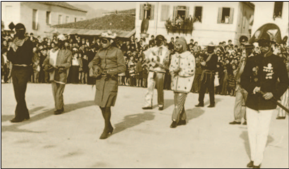
Η μαντολινάτα κάπου στις αρχές της δεκαετίας 1950-1960, με φόντο την ανατολική πλευρά της πλατείας βορείως του κτηρίου της Εθνικής Τράπεζας