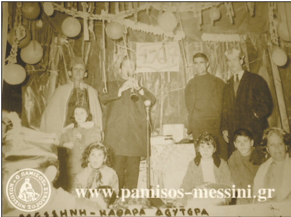
Δεκαετία του 1960-1970, δεξιά όμιλος χορευτών και αριστερά η ζυγιά (τούμπανο και μάλλον κλαρίνο) που τους συνοδεύει