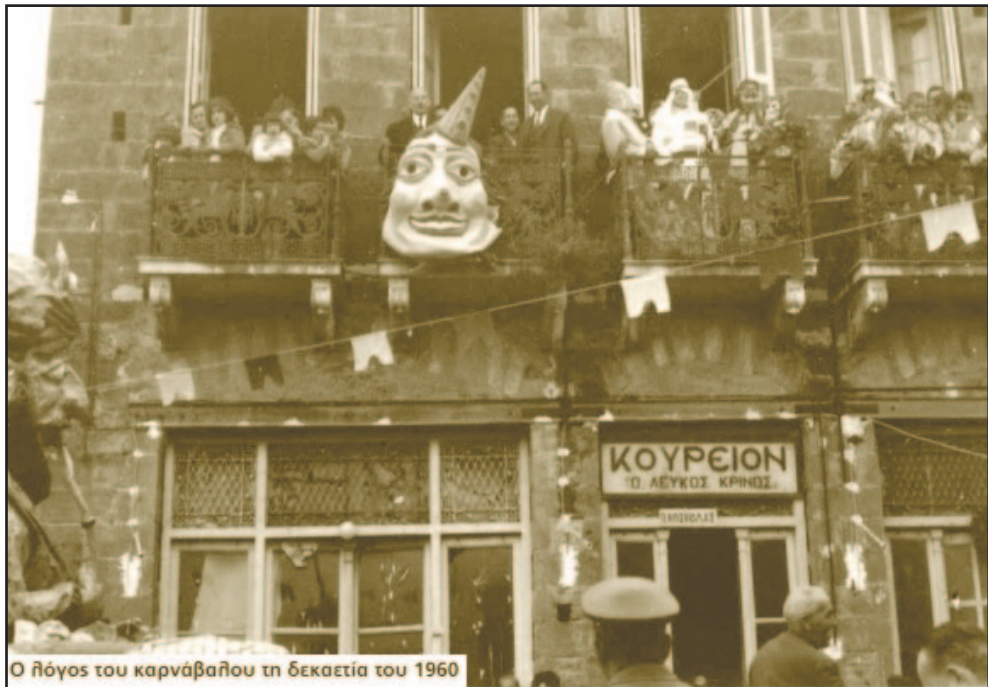
Ο καρνάβαλος εκφωνεί λόγο από το μπαλκόνι αρχές της δεκαετίας του 1960