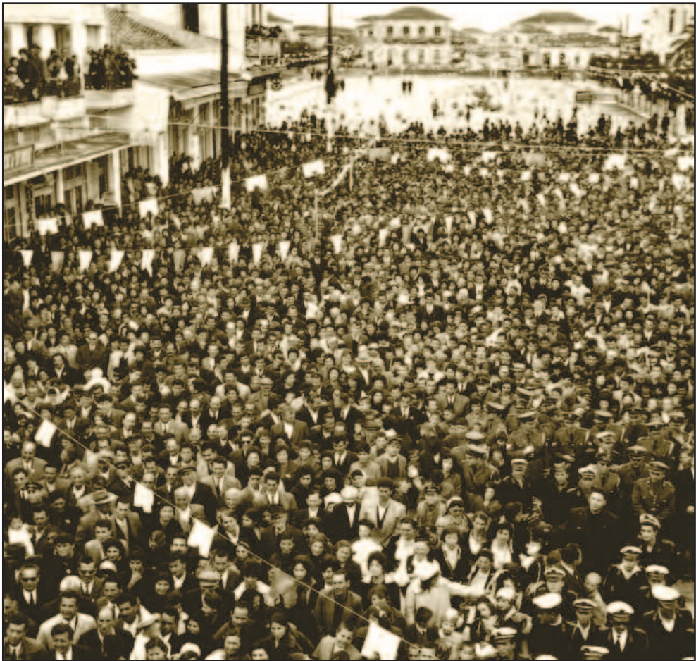
Πλήθος κόσμου παρακολουθεί το λόγο του καρνάβαλου στη νότια πλευρά της πλατείας

εμφανισθή ο Καρνάβαλος, θα ακολουθούν δε όμιλοι ανδρών και θα παιανίζουν η μουσική και εγχώρια όργανα. Θα παρελάσουν φουστανελλοφόροι νέοι και νεάνιδες και διάφορα θεάματα. Την εσπέραν θα φωταγωγηθή η πόλις και θα καούν βεγγαλικά και άπασα η πόλις θα παρουσιάξη φαντασμαγορικόν θέαμα. Η επιτροπή δε μετά το τέλος των παρελάσεων θ' απονείμει διάφορα χρηματικά βραβεία. Εν γένει ο εορτασμός της Καθαράς Δευτέρας θ' αφήση εποχήν. Την ημέραν εκείνην έκτακτα τραίνα θα μεταφέρουν τον κόσμον των επισκεπτών».