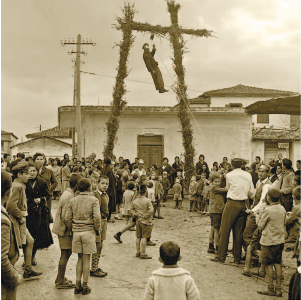
Τη δεκαετία 1950-1960 όταν η κρεμάλα είχε αυθεντικό χρώμα ακόμη χωρίς... μύθους