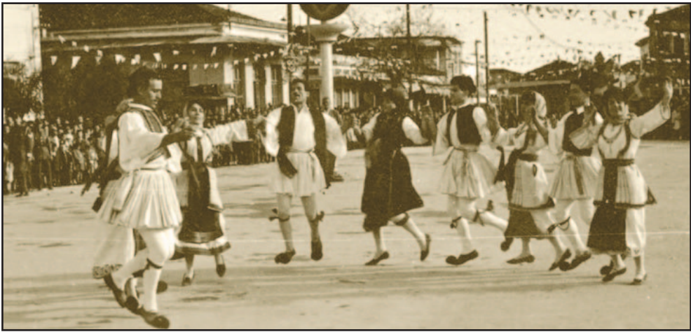
Χορευτικός όμιλος στο καρναβάλι τη δεκαετία 1960-1970

κοντογούνια, επλήρουν τον ευρύν ορίζοντα. Ας τα ακούσουν αι ψευτοαριστοκράτισσαι της πόλεώς μας, αι οχυρούμεναι υπό γελοίαν σοβαρότητα διά να γλεντήσουν τας αποκρέω, αι χύνουσαι διά της ψυχρότητας των Ηνωμένων Παγοποιείων, αι υποδεχόμεναι μιαν χούφταν κομφετί με μορφασμόν αηδίας σαν να κατέπιον το κώνιον του Σωκράτους, καταπίνουσαι ίσως την κάμηλον και διυλίζουσαι τον κώνωπα [...] Ας αφήσωμεν τας κυρίας να χορεύσουν τον λεβέντικον χορόν σεισοπηγούσαι και κραδαινόμεναι εις χαριέσσας κινήσεις υπό βροχήν κομφετί και σερπαντέν ριπτομένων από τον τυχόντα χωρίς παρεξήγησιν, ενώ τον όλον χορόν εφορεύει η: Φιλαρμωνικοί Μουσεικί Μεσσείοις αλατισμένη μασκαράτα παροδούσα την έλλειψιν φιλαρμονικής εν Μεσσήνη, με νεροκολοκύθα και σκουριασμένα χωνιά και ντενεκέδες ως όργανα, και έλθετε φωτογραφήσωμεν είκοσι φουστανελλοφόρους ασίκηδες, λεβεντόμορφους χορεύοντας Αρβανιτικον και συρτόν εις τα “Αλώνια” της Μεσσήνης, την ευρείαν πλατείαν της. Τα τραπέζια των περίξ καφενείων χρησιμεύουν ως θεωρεία εις όλους τους παρεπίδημους Καλάμιους. Το ευσταλές των χορευτών, η πλούσια λευκάζουσα φουστανελλά των, τα ολόχρυσα τουζουλούκια και τα αργυρόστικτα καλπάκια, αι ελεύθεραι κινήσεις εις τον μυρωμένο αέρα του ανοικτού ορίζοντος,