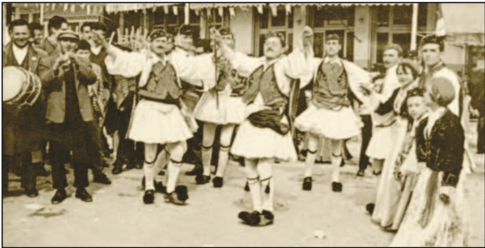
Δεκαετία του 1960-1970, δεξιά όμιλος χορευτών και αριστερά η ζυγιά (τούμπανο και μάλλον κλαρίνο) που τους συνοδεύει

Δ ομικό στοιχείο του Νησιώτικου καρναβαλιού ο χορός ανδρών και γυναικών με παραδοσιακές στολές αλλά ο χορός θέλει και... όργανα. Τα συναντάμε σε μια περιγραφή του 1938 όπου αναφέρεται ότι “τους στίχους του ποιητού του Κάρου διαδέχονται φωνές ουρανομήκεις, ιαχαί, αλαλαγμοί, μεταξύ των οποίων εξεχώριζεν η πατροπαράδοτος Νησιώτικη μουσική της πίπιζας, του κλαρίνου και των τυμπάνων”. Και μπορεί να τα συναντάμε τότε ως γραπτή αναφορά, έρχονται όμως από τα βάθη των αιώνων ως “ζυγιά”, αρχέγονος αγροτικός τρόπος μουσικής υποστήριξης του χορού. Στην ελληνική μουσική παράδοση, ζυγιά είναι το ζευγάρι δύο οργάνων που συμπληρώνουν το ένα το άλλο. Η λέξη θεωρείται μεσαιωνικής προέλευσης και το ζευγάρι συναντιέται με διαφορετικά όργανα κατά περιοχές της Ελλάδας. Πάντα ένα όργανο δίνει το ρυθμό και το άλλο παίζει τη μελωδία. Στην Πελοποννησιακή