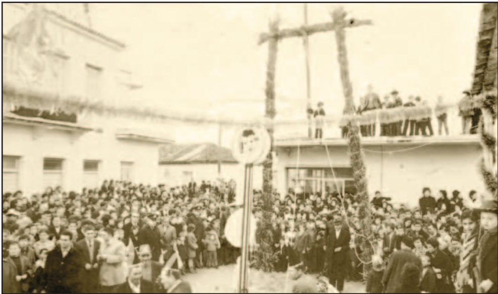
Κρεμάλα τέλη της δεκαετίας του 1960

φυλάσσει. Η τεχνική της τραμπάλας/κρεμάλας των σκύλων φαίνεται ότι είναι η ίδια παντού. Ο θάνατος του ζώου δεν είναι απαραίτητος, πιο σημαντικό φαίνεται να είναι το τρομερό ουρλιαχτό που έχει ως συνέπεια το διώξιμο των δαιμόνων (και να μην ξεχνάμε ότι και οι καλικάντζαροι εμφανίζονται με τη μορφή σκύλου). Η γεωγραφική εξάπλωση του έθιμου δεν φαίνεται να έχει κάποιο ιδιαίτερο ειδικό βάρος, αντιθέτως οι αναφορές είναι τόσο λίγες που δεν μας επιτρέπουν να χαρακτηρίσουμε το έθιμο πανελλαδικό. Υπάρχει μια αντίφαση ανάμεσα στην τιμωρία και στο γεγονός ότι ο σκύλος είναι κατοικίδιο ζώο και μάλιστα φύλακας. Φαίνεται αταίριαστη μια τέτοια συμπεριφορά απέναντι σε αυτό το χρήσιμο ζώο και ακριβώς αυτή η “παράλογη” διαφορά στη συμπεριφορά μαρτυρά ότι το έθιμο έχει ένα επίπεδο ερμηνείας που δεν μπορεί να προσδιοριστεί με τη λογική”.