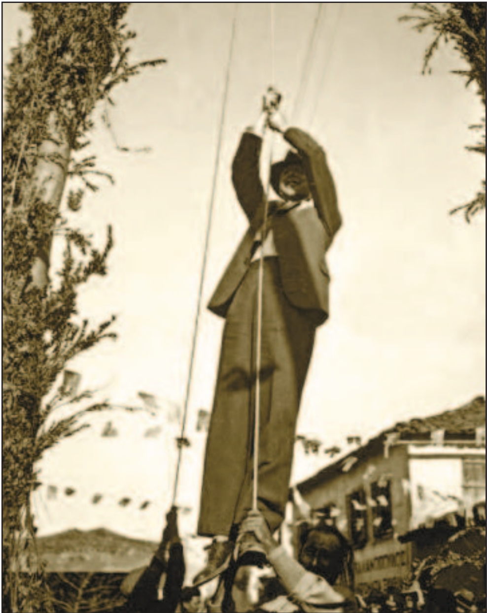
Η κρεμάλα λίγο πριν το δεύτερο παγκόσμιο πόλεμο