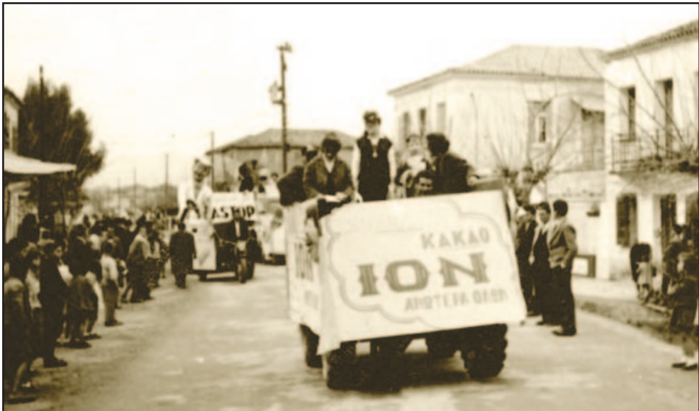
Η διαφήμιση κάνει παρέλαση και πετάει προϊόντα στους καρναβαλιστές

Δημοσίευμα επικρίνει σφοδρά τις μεσσηνιακές επιχειρήσεις καθώς καμία δεν συμμετείχε με δικό της άρμα: “Γενικόν θέμα σχολίων η απουσία του τοπικού χρώματος. Ούτε μια βιομηχανία, ούτε ένα ερ-