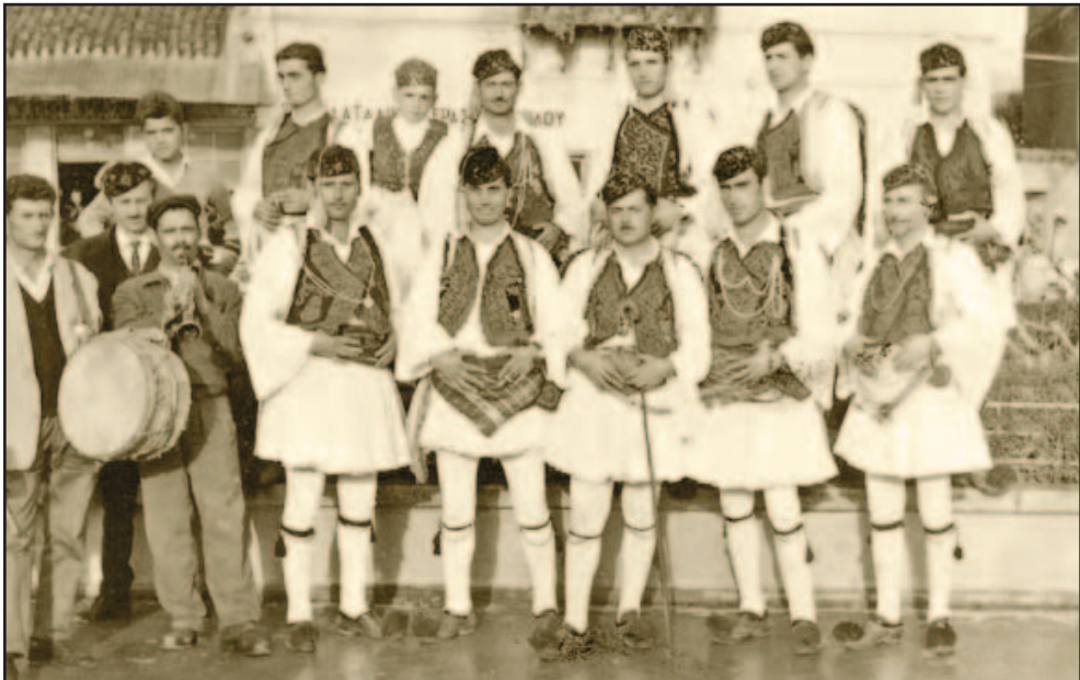
Ομιλος φουστανελοφόρων τη δεκαετία 1960-1970

Τ ο 1911 το Νησιώτικο καρναβάλι αποκτά καινούργια χαρακτηριστικά καθώς συμμετέχει σε αυτό η νεοσύστατη Φιλαρμονική, ενώ δήμος εμπορικός σύλλογος και πολίτες συμμετέχουν στα έξοδα διεξαγωγής του. Νέο στοιχείο και τα βραβεία σε χορευτικές ομάδες και μασκαράτες. Γράφει ο ανταποκριτής του “Θάρρους” από το Νησί: “Η Καθαρά Δευτέρα, ανέκαθεν εορταζόμενη εν τη πόλει μας, απεφασίσθη εφέτος να εορτασθή μετά περισσότερας μεγαλοπρεπείας. Προς τούτο κατεβλήθησαν υπό του Δήμου, του Εμπορικού Συλλόγου και πολλών εκ των κατοίκων αρκετά ποσά διά τας απαιτούμενας δαπάνας προς λαμπροτέραν διεξαγωγήν της εορτής. Η πόλις ολόκληρος θα διακοσμηθή καλλιτεχνικώς, ιδίως δε η αγορά και αι πλατεΐαι, εις τα οποίας θα παιανίζει η αρτισύστατος